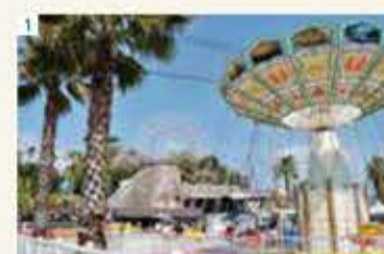
1 バルバル遊園地 【ホテルより車で約20分】 かんざんじ温泉の浜名湖湖畔にある遊園地。 ジェットコースター、観覧車、おとぎ電車などさ まざまな楽しい乗り物があります。お得な入園 券付宿泊パックもご利用しております。