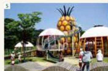
5 フルーツパーク 鶴之橋 【ホテルより車で約30分】 味覚狩りが楽しめる人気レジャーパーク。 ワイナリーやビアレストランも併設。