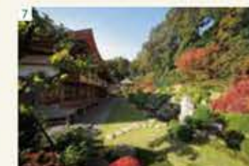
7 龍潭寺 【ホテルより車で約20分】 井伊直虎ゆかりの地。 国の名勝。四季折々に楽しめる。