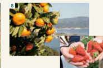
8 三ヶ日町かんざんじ 【ホテルより車で約15分圏内】 10月中旬~12月中旬 いちご狩り (平松観光アグリ浜名湖) 【ホテルより車で約30分】12月中旬~5月上旬