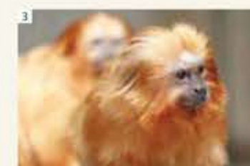
3 浜松市動物園 【ホテルより車で約20分】 国内唯一の希少動物「ゴールデンライオンマ リン」や、「ホッキョクグマ」に出会えます。定期的 にイベントも開催。