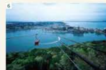
6 かんざんじロープウェイ 【ホテルより車で約30分】 浜名湖/バルバルから大草山の頂上を目指し登り ます。頂上には、浜名湖オルゴールミュージアム があります。