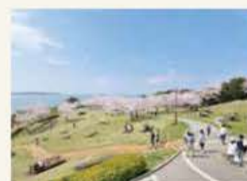
浜名湖サービスエリア【ホテルより車で約5分】 恋人の聖地「浜名湖ハートロック」に、ずっと一 緒にという願いをこめて。

ご家族、カップル、グループ旅行に。 四季折々に楽しめる浜名湖で 観光三昧しませんか。 ホテルにて各施設の割引券も ご用意しております。