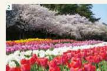
2 フラワーパーク 【ホテルより車で約20分】 広い園内に観賞用大温室をはじめ、原種ツツジ、 バラ園、花菖蒲園など3000種10万本の植物 を四季を通じて美しく見る事が出来ます。