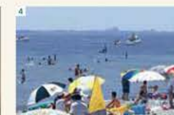
4 女河浦海水浴場 【ホテルより車で約20分】 かんざんじサンビーチ海水浴場 【ホテルより車で約30分】